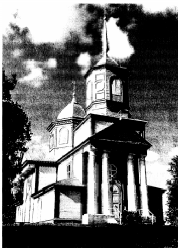
Храм у гонар Святой Тройцы у аграгарадку Блонь

трынаццаць разоў. Трынаццаць радкоў на стэндзе, якія адлюстроўваюць развіццё адукацыі ў краіне і дасягненні ў сельскагаспадарчым навучанні, і змены ў правапісе, і ўзнагароды... Хтосьці звяртае ўвагу на паходжанне назвы паселішча Мар'іна Горка. Нехта не можа адарваць вачэй ад фотаздымка храма Успення Багародзіцы. Некаму цікава, хто такі Міхаіл Рудовіч, імя якога названа не толькі цэнтральная вуліца ў пасёлку Мар'іна, але і чытальная зала бібліятэкі каледжа, пры гэтым яго няма ў спісе знакамітых выпускнікоў. Хто такі Уладзімір Лабанок, чьё імя носіць каледж? Гэта далёка не ўсе тэмы для даследаванняў, якія можа прапанаваць экспазіцыя народнага музея гісторыі. Тое, да чаго прызвычалася ўжо больш дарослай аўдыторыя, становіцца прывабнай загадкай для таго, хто адгортвае новую старонку свайго жыцця, атрымаўшы статус навучэнца каледжа.